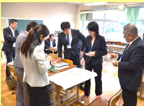
授業研究会における小・中の交流