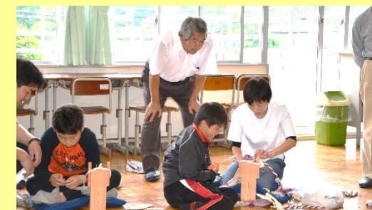
布ぞうりづくり体験