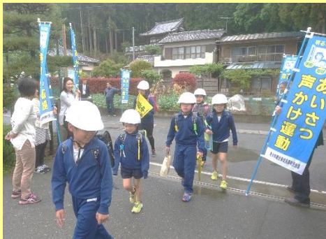
P T A ・ 地域による挨拶運動の実施