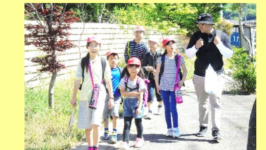
縦割り班での遠足