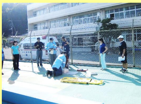
アクションカードを活用した事故発生時対応訓練の実施