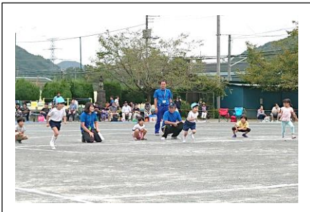
【よーいドン もうすぐ1年生】