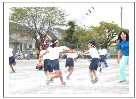
【全校全カリレー・低学年】