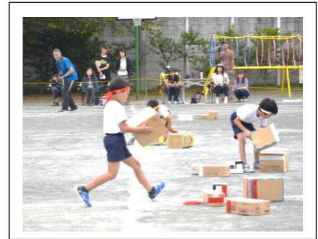
【いそげ！長二宅急便】