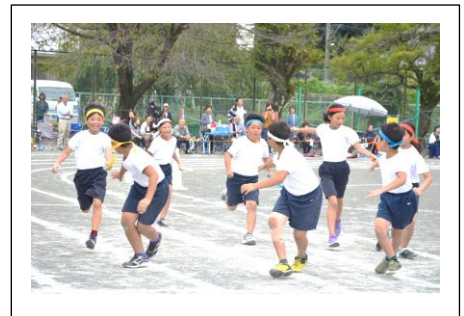
【全校全カリレー・高学年】