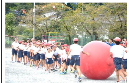
【全校大玉送り「つなごうみんなの力」】