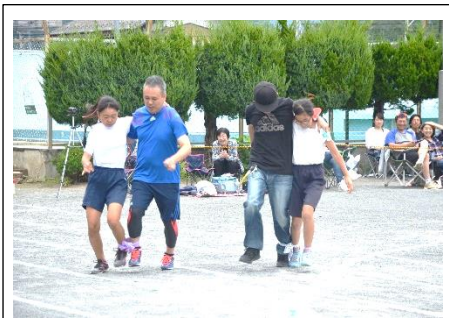
【うれしはずかし 親子で1・2】