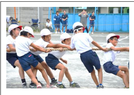
【力を合わせて！全校綱引き】