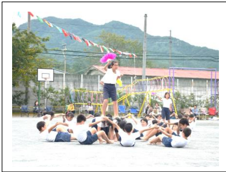
【バックトゥザフューチャー～昭和から令和～】