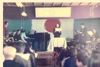
【校歌制定・開校100周年記念式典】

29日（水）の朝会では、開校記念日集会として、本校を卒業した大先輩からのお話を聞き、伝統ある本