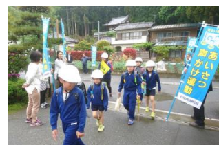
スマイルあいさつ運動