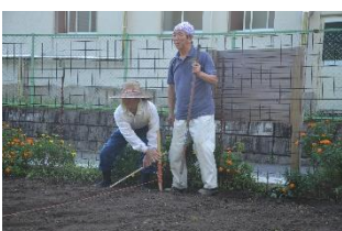
学校ファームの整備