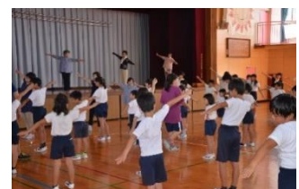
全校 秩父音頭指導