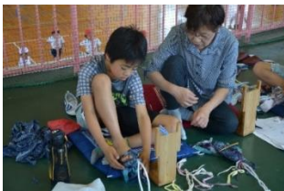
6年 布ぞうりづくり

学校教育目標「豊かな心の子、よく勉強する子、健康で明るい子」の具現化に向けて、地域の教育力の向上を図るとともに、学校・家庭・地域が一体となって学校応援団活動を進めています。ボランティア登録数は130名です。