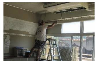
P T A 親子奉仕作業